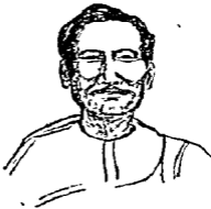
जस्टिस शारदाचरण मित्र

बंगाल के लोगों ने हिन्दी के निर्माण के लिए जो कुछ किया, उसकी चर्चा